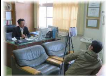
【学校長あいさつ撮影の様子】

まだ新型コロナウイルスの終息は見えませんが、桜山中学校PTAはこのように感染拡大防止のために工夫を凝らしながら本年度の活動も充実させていきたいと思ひますので、なにとぞご理解とご協力をお願いいたします。