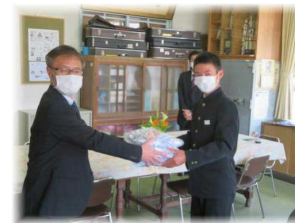
【市からのマスク寄贈式】