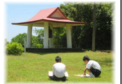
【右:鐘楼広場でのスケッチ】

5/9にスケッチ大会が計画されていましたが、5月の土曜授業が中止になったため、11日に変更して実施しました。