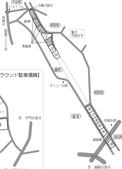
【妙見グラウンド駐車場隣】