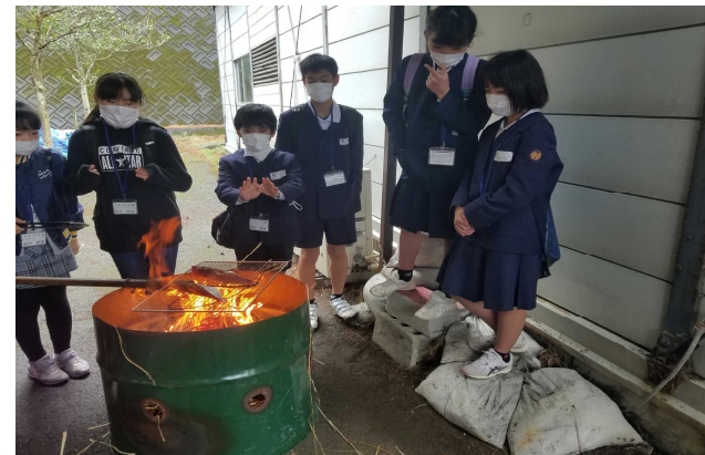
【カツオの薫焼きをする子どもたち】

本年度の検定には、5年生13名と6年生3名の計16名が挑戦しました。カツオのさばき方やカツオ漁の歴史を学んだり、カツオ節工場の見学などを行った後、検定を受け、見事全員合格しました。その中で5名の子が満点(優秀賞)に輝き、代表2名が来る5月4日(土)に市長さんから表彰されることになりました。