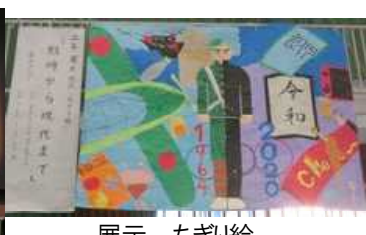
展示 ちぎり絵『戦時から現代まで』