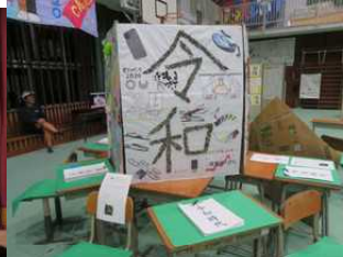
展示 身近なもので表現『明治から令和へ』