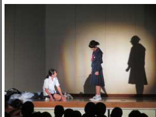
劇『戦争を知らない子供たち』

★桜の木をとりまく様々な人の物語を劇として発表し、明治から令和までの時代を象徴するものの展示を行いました。