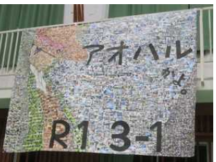
展示 モザイクアート『思い出の写真』