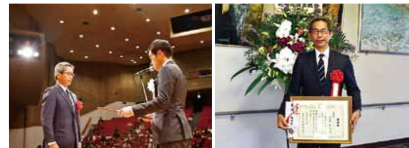
枕崎市制施行70周年記念式典での表彰の様子