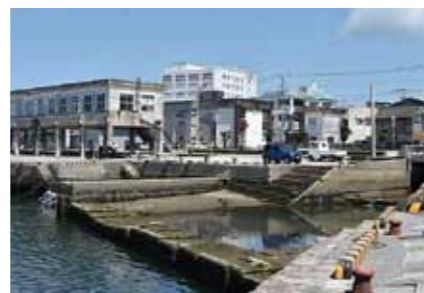
▲現在の神園川河口