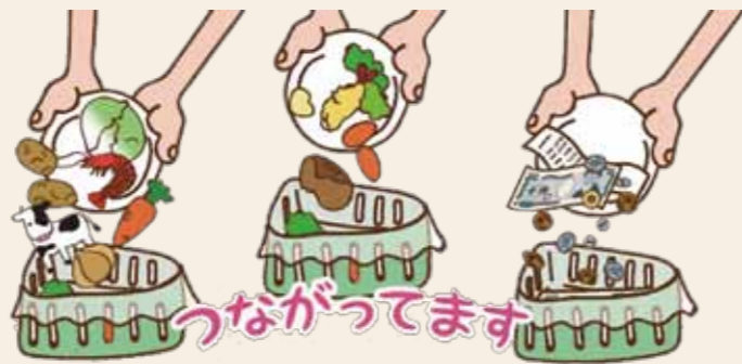
イラスト出典：食品ロス啓発用パンフレット(基礎編) 平成30年10月版(消費者庁)加工して使用

600万トンを超える食品ロスのうち家庭から発生する量は約300万トンで、おおよそ半分を占めています。