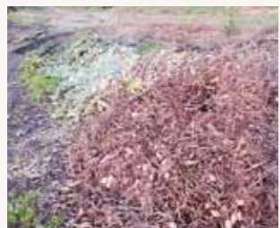
収穫残さを放置しないようにしましょう

・水田では、収穫後も電気柵等を適切に設置することで獣の農地への侵入を防止し、収穫後に伸びた稲の葉やレンゲを獣が食べられないよう