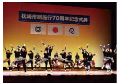
▲フィナーレを飾った祝い太鼓