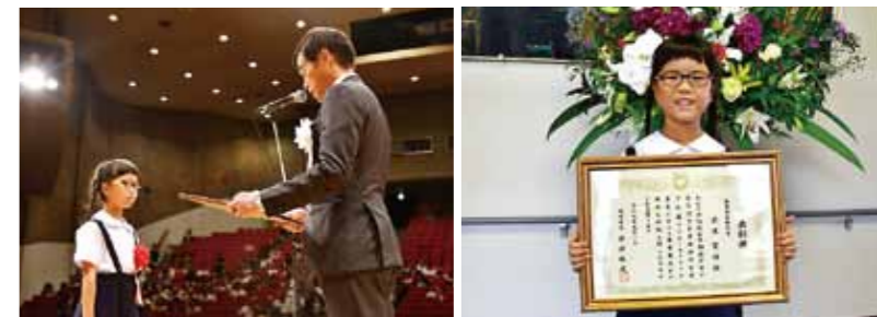
枕崎市制施行70周年記念式典での表彰の様子