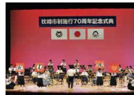
▲オープニングの吹奏楽演奏

公園に、「未来をつむぐ幸せの鐘」が建立されました。この鐘は20代から40代までの地元有志が2年かけて寄附を募り、建立し本市に贈呈してくれたものであります。平成25年には、本土最南端の始発・終着駅である枕崎駅が、駅舎の復活を望む多くの市民の声を受け、市民の寄附により建設されました。また、毎年8月に開催される南薩摩最大の夏祭り「さつま黒潮」きばらん海「枕崎港まつり」では、九州で唯一の三尺玉の花火が打ち上げられますが、この打ち上げ費用は市民の寄附によるものです。本市はこのように「市民の力が形になるまち」として、市民の想いとともに成長してまいりました。 さて、本日は市勢発展のため永年、献身的にご尽力されました方々のご功績に対し、功労の表彰を執り行いたいと存じます。 受賞される皆様のご功績とご労苦に対しまして、改めて敬意と感謝の念を表しますとともに、今後とも本市発展のために引き続きご支援、ご指導を賜りますようお願い申し上げます。 結びに、ご臨席を賜りましたご来賓の皆様、並びにご参会の皆様には、今後とも枕崎市の発展のために、ご指導・お力添えを賜りますようお願い申し上げますとともに、皆様のご健勝とご活躍を祈念いたします。私の式辞とさせていただきます。