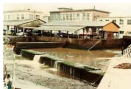
▲40年前の神園川河口

公共下水道は、快適な生活環境をつくるとともに、海や川の保全のため機能しています。下水道接続可能地域にあって、未接続の方は早期接続を、また既にご利用いただいている方は、引き続き適正な使用をお願いします。