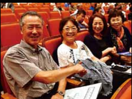
▲会場の皆さんで「優しく貯金ゲーム」

人って、手をつないだ距離感で「バカ」とか「死ね」とか言えるんです。直してほしいところばかり言われると、「私のこと嫌いなんな。嫌じゃやけえ、あんなに攻めるんかな」と、そう思うんです。でも、良いところも言われると、「私を嫌いなんじゃない。直してほしいところを教えてください。