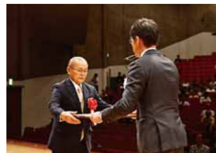
▲市政功労者表彰の様子