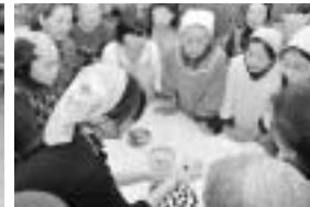
▲「ふれあいサロン枕崎」で行われたさく餅つくり体験の様子