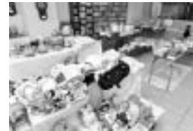
▲「ふれあいサロン枕崎」隣にあるリサイクルショップ「あたらっか堂」にはさまざまな商品がズラリと並ぶ