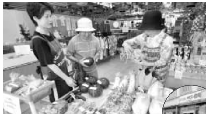
▲地域住民の交流の場として期待される「ふれあいサロン枕崎」。毎日多くの人が訪れ、笑顔で溢れています。