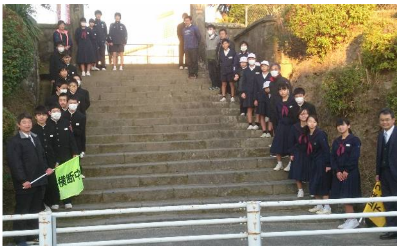
桜山小中学校合同あいさつ運動