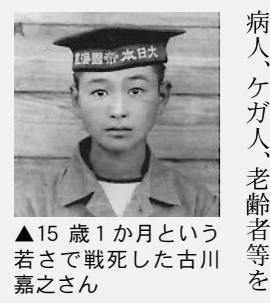
▲15歳1か月という若さで戦死した嘉

枕崎市観光ボランティアガイドの2グループ『花渡川クラブ』と『わだつみ会』が隠れた枕崎観光の魅力に迫ります。