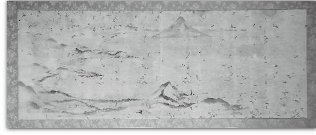
枕崎風景画(市指定文化財)

枕崎弁 「すんくしら狂句」 【投稿先】総務課秘書広報係 TEL7200000 ■ 回の詳細は「枕崎の狂句会」 http://www.voicebloj.jp/kukai/ 住み居れば 枕崎が終だと ここが言う (西本町ゆるりさん) 作者は、コーナー枕崎愛人である方の奥さんである。彼女の故郷は遠 き地、しかし枕崎(こ)を終(つ)いの住処と思えるようになってきた 昨今の心情を詠んでいる。メの「こ」が「こ」に、得も言われぬ 含蓄を芳せているのではないかと、彼女も枕崎愛人である。 こどんうめ メジロが居らじ ハレがせじ (下レミっちゃん) 「こどんうめ」は「今年の梅でもあり子供産め」でもある。子どもも数 が増えて欲しい街を愛する人々は皆、そう願っている。 「謎掛け」「鬼(福)とかけてなんととく 「コントロール重視のピッチャー」とどく、 そのころは? 右、左下に答え 「キス」よりも「チュー」ちゆだ方がグッと来る (豆嫁) 鬼よっけん いどっかが 我が家おっ 出っちっごっ ハシと投げんな そだます魂込めっ (鬼嫁)