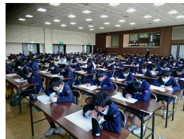
【鯉節工場の見学】 【検定の様子】