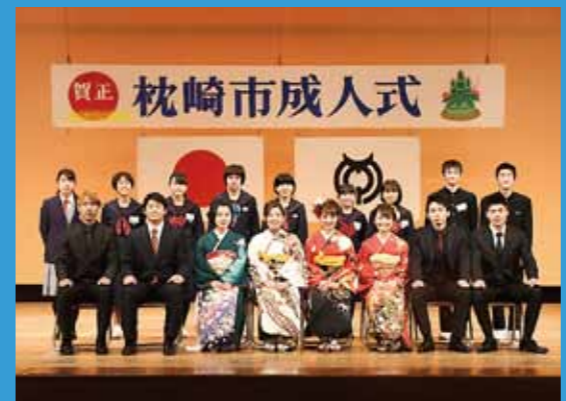
成人式実行委員とボランティアスタッフ

中学生、高校生の9人がボランティアスタッフとして成人式の準備や、当日の受付をはじめ、進行・舞台係として運営に携わり、新成人の門出に華を添えました。