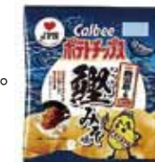
▲「鰹みそ味」のポテトチップス

1月16日には県庁で報道発表が行われ、鹿児島市の鹿児島幼稚園の園児によるかつおみそ作り体験も行われました。