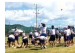
▲中学校体育大会への参加