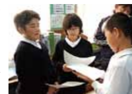
▲自ら考え議論する授業