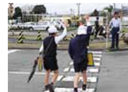
▲南海自動車学校での交通安全教室