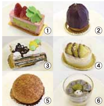
①かつかつベリーハッピー! ②和まる ③Sante' ④和～なごみ～ ⑤くつきーだしゅー ⑥たもいやんせ(めしあがれ)