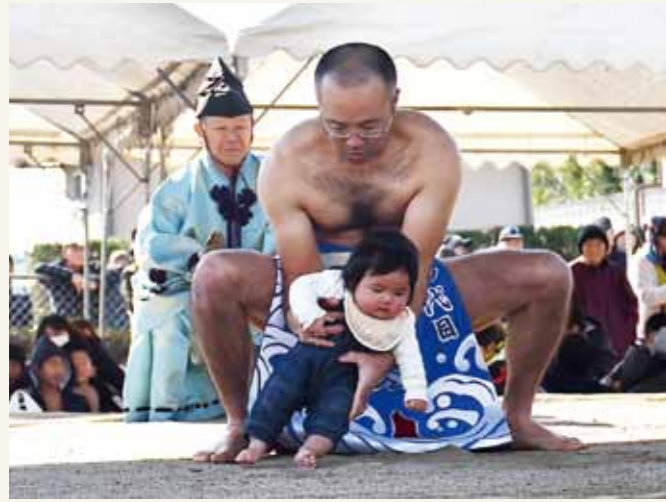
▲子どもの健やかな成長を願われる「赤ちゃん土俵入り」