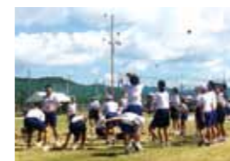
▲中学校体育大会への参加