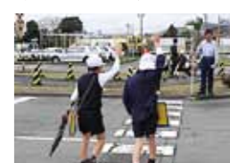
▲南海自動車学校での交通教室