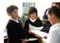
▲自ら考え議論する授業