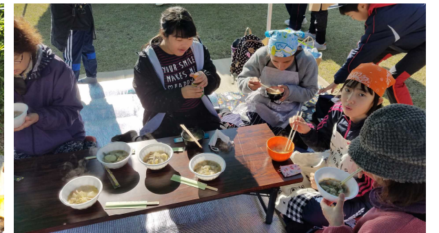
【できあがったそまんずしを皆で試食です】