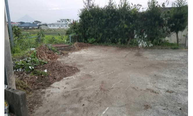
【草が撤去されきれいになったゴミすて場】

12月16日（日）は門松作りの予定でしたが、あいにくの雨模様で24日（月）に延期になりました。そんな雨模様の中、来校された事業部やおやじの会の皆様が、ゴミすて場の枯れ草やゴミを撤去してくださいました。本当にありがとうございました。