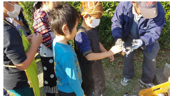
【焼き芋も楽しみの一つ】