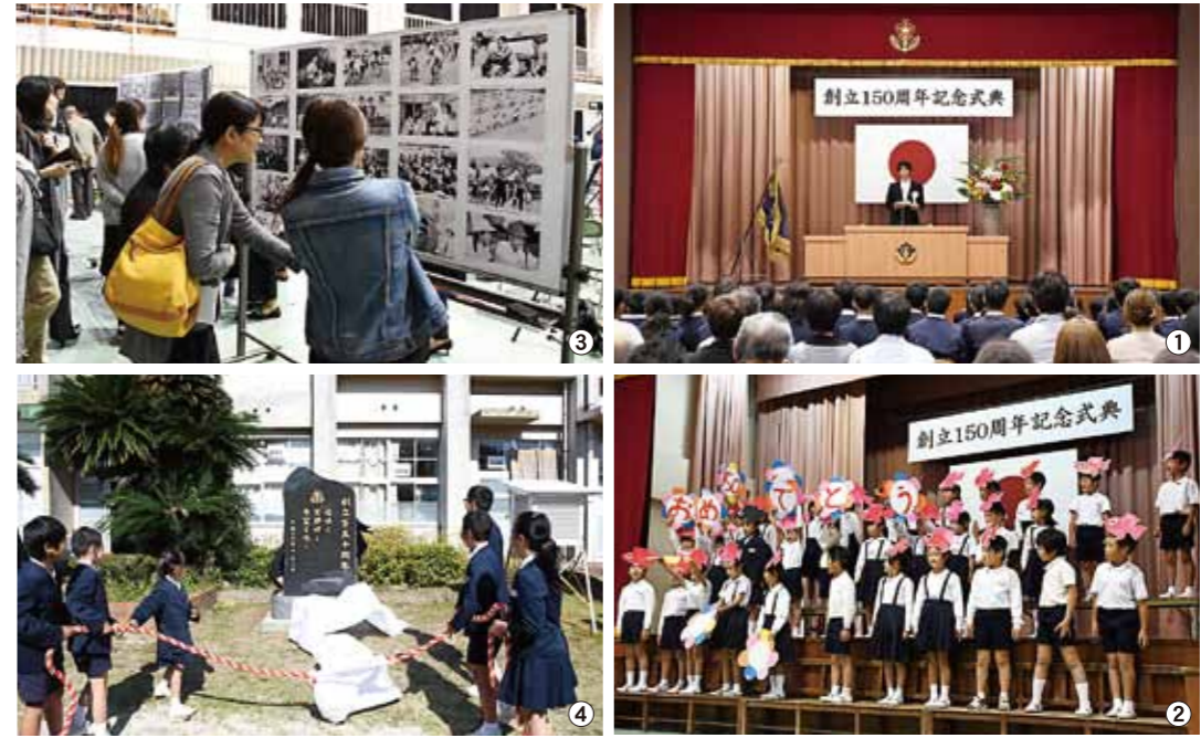
①創立150周年記念式典の様子 ②2年生による「スイミー」の学習発表 ③会場に展示された写真を懐かしむ来場者 ④記念碑の除幕式の様子

桜山小学校の創立150周年の記念式典が11月10日、同校の体育館で開催されました。同校は明治2年に鹿児島藩第2郷校として創立され、明治12年から桜山小学校として現在の地に建てられ、今年で創立150年を迎えました。