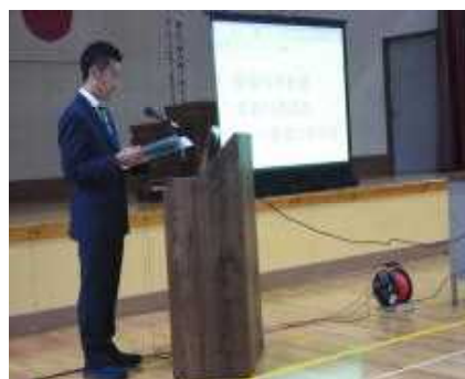
【N先生の研究の説明】

本校は、昨年度から2か年間、南薩教育事務所と枕崎市教育委員会の指導を受けながら「算数科教育」の研究と実践に取り組んできました。その研究と実践の一端を市内外の先生方に公開しました。