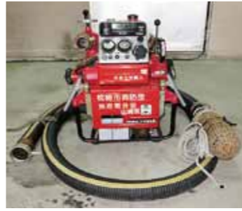
▲消防団小型動力ポンプ一式(2)