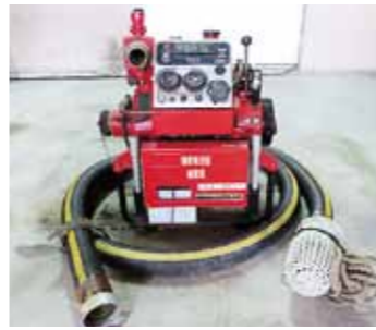
▲消防団小型動力ポンプ一式(1)