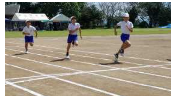
【全力疾走する6年生】