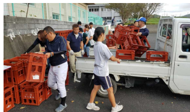
【空き瓶回収の様子】

午前7時から、小・中合同PTA空き瓶回収を行いました。早い地域は6時半過ぎに搬入をしていました。今回の空き瓶回収は、前年度2月と比較すると収益が約1万円アップしました。空き瓶回収に尽力されたPTA事業部の皆様、地域委員長の皆様、そして、たくさんの空き瓶やアルミ缶を提供して下さった地域の皆様、ありがとうございました。