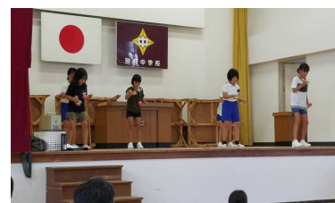
【けん玉コンテストの様子】

午後1時30分からは、別府中学校の体育館を借りて「親子伝承遊び大会」を行い、「けん玉」「お手玉」「コマ回し」という昔懐かしい遊びに挑戦しました。楽しいひとときを過ごすことができました。(会場を提供して下さった別府中学校に感謝申し上げます。)