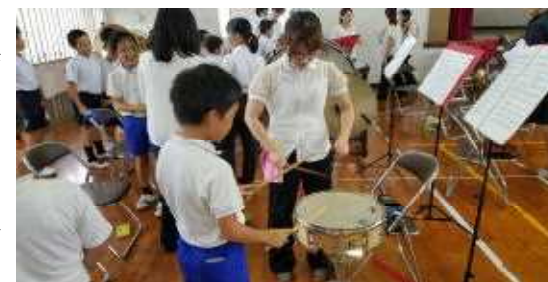
【楽器とのふれあい活動】

アニメメドレーや指揮者体験、楽器とのふれあい活動をとおして、楽しく充実したひとときを過ごすことができました。