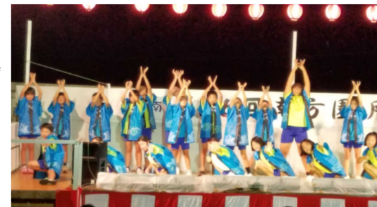
【最後の決めポーズ】

会場を埋め尽くした多くの方から大きな拍手をいただき、子どもたちは皆満足そうでした。