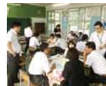
▲小・中合同職員研修

小・中合同あいさつ運動(第3金曜日)、中学生による読み聞かせ(第2土曜日)、小5と中1による宿泊学習(一部合同)、中3生徒の桜山小における職場体験学習の受け入れ、小・中合同職員研修の実施などさまざまです。