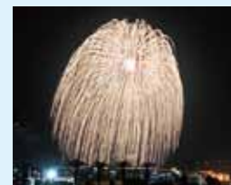
▲三尺玉(南浜館から撮影)

んの方に祭りを楽しんでいただけると嬉しいですね。(東本町・Y) Yさんお便りありがとうございます。今年は天候にも恵まれ、無事に祭りを終えることができました。花火の後の渋滞については、大勢の方が一斉に帰り始めるため、解消することはなかなか難しいと思います。警察などの関係機関と連携し、少しでも渋滞の緩和が図られるよう努めていきたいと思