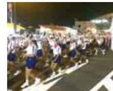
▲H30 きばらん海総踊り

また、ふるさと行事への参加を大切にしています。「黒潮すもう大会」「きばらん海総踊り」等への参加に向け、教児一体となって取り組んでいます。