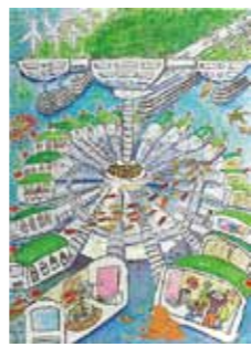
▲中川路くんの作品