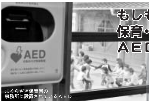
まくらざき保育園の事務所に設置されているAED