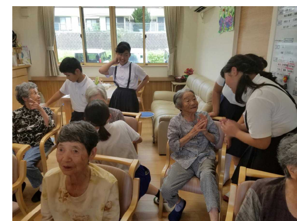
【高齢者の方々とふれあい】