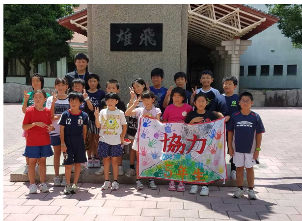
【モニュメント前で記念撮影】