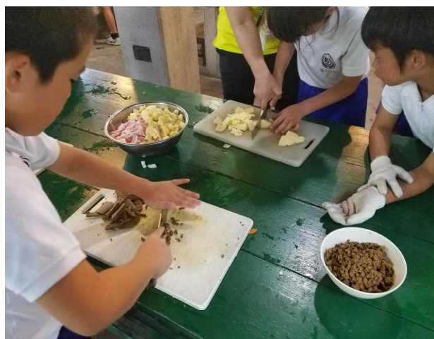
【カレーの材料をきっています】

5年生の学級目標は「協力」です。それを強く感じた宿泊学習でした。全てを掲載することはできませんが、宿泊学習の様子を写真でご紹介します。