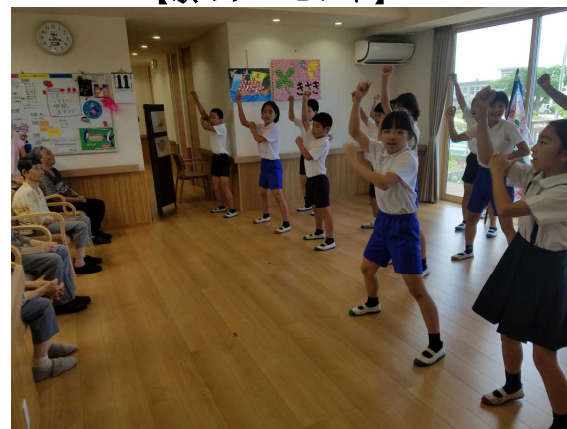
【ソーラン節・勝男武士の舞】