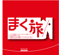
▲CD「まく旅」ジャケット

また、音楽を通してたくさんの人と出会い、ふれあい、多くのことを学び吸収することで、自分自身、成長することができて