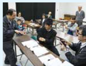
▲昨年度の手話教室の様子

身体の不自由な人々への理解と手助けをしていただくための手話講習会を開催します。自己紹介や簡単なあいさつから始めますので、気軽に参加してください。