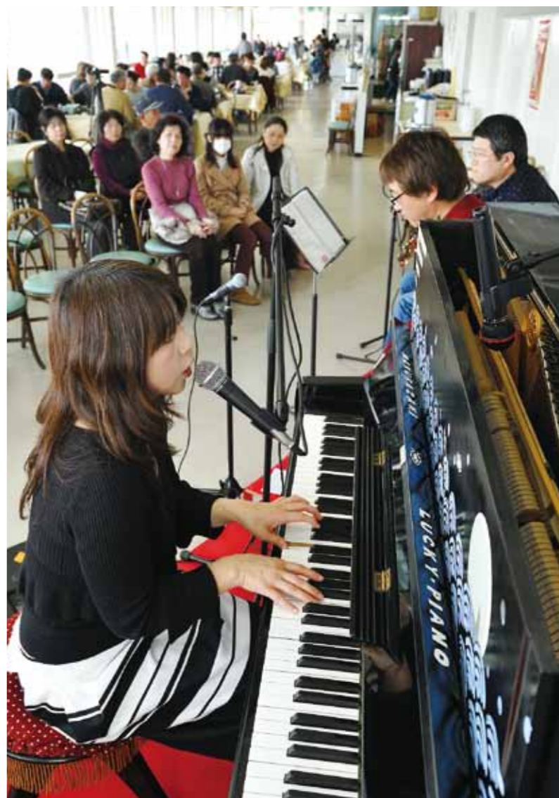
演奏をするRENSのメンバー。2階レストランに優しい音色が響く

この日は3連休の中日ということもあり、大分県からの団体をはじめ、県内外から多くの観光客が訪れていました。RENSは「枕崎ぶえん鯉」や「アートストリート」、「火の神岬」など枕崎の