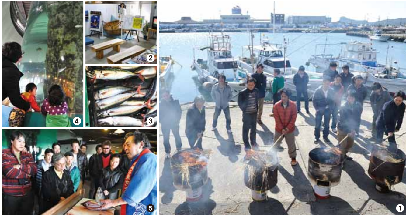
①カツオのわら焼きタタキ作りを体験する観光客 ②昨年4月に枕崎市観光協会が開設した観光案内所 ③鮮魚店にはサバやムロアジなどの青物をはじめ、とれたての魚介類が並ぶ ④円筒型の大水槽ではマダイやイサキなど色とりどりの魚が泳ぐ ⑤カツオ解体ショーの様子

「お魚センターの経営状態は大丈夫なの？」 よく耳にする会話です。確かに近年は、長引く不況や旅行形態の変化などの影響もあり、観光客数は減少傾向にあります。そんな中、平成23年度の純利益は3年ぶりに黒字に転じるなど、経営改善は着実に進んでいます。その原動力の一つが、一昨年6月から始めた体験型観光メニュー「カツオのわら焼きタタキ作り体験」です。今年度の体験者は