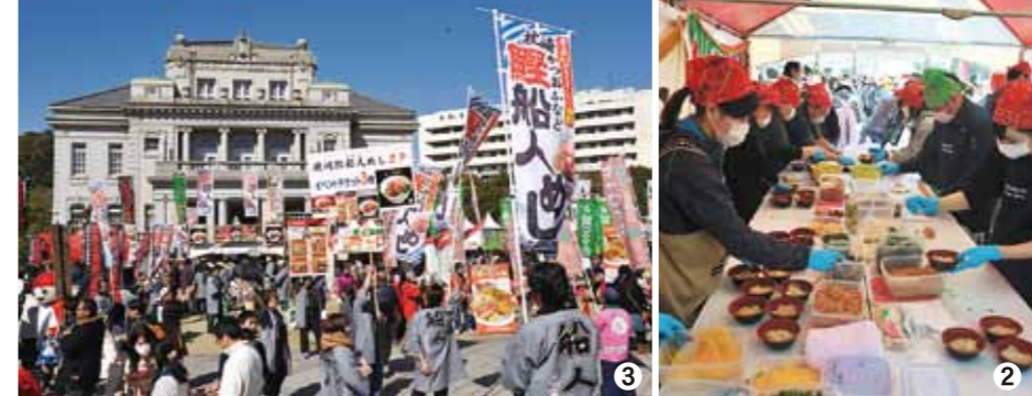
①2連覇を喜ぶスタッフ ②延べ200人を超えるボランティアスタッフが「枕崎鯉船人めし」の快進撃を支えました。 ③本大会2日間で約4万5000人が訪れました。