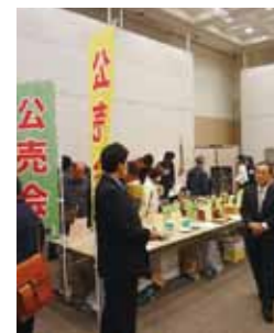
▲合同公売会の様子