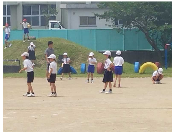
【スマイルグループで遊んでいる様子】