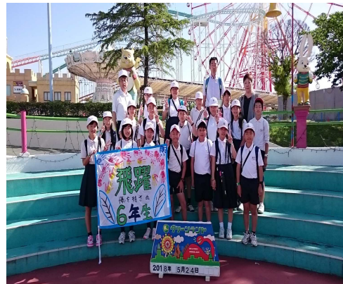
【グリーンランドでの記念撮影】