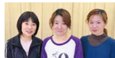
▲体重部門第1位「ちびちびふれんず」 みんなで励まし合いながら（実は足を引っ張らないようにプレッシャーを感じながら）、間食をしない、カロリー計算をする、大好きなビールを減らすなど頑張りました。

昨年6月に開幕した「本気三人衆ダイエットコンテスト」の最終審査会が2月17日、健康センターで行われました。 生活習慣病の増加が深刻な本市の現状を打開しようと、今年度初めて開催した同コンテスト。47組（141人）が体重と体脂肪率の2部門でスリム化を競いました。 結果は体重部門で「ちびちびふれんず」が、体脂肪率部門で「あじさい」がそれぞれ第1位に輝き、表彰式では賞状と豪華賞品が贈られました。 参加者からは「食生活など、自分を見直すいい機会になりました。毎日の暮らしが楽しくなりました」、「血糖値が下がり、薬を飲まなくてよくなりました」といった声が聞かれました。