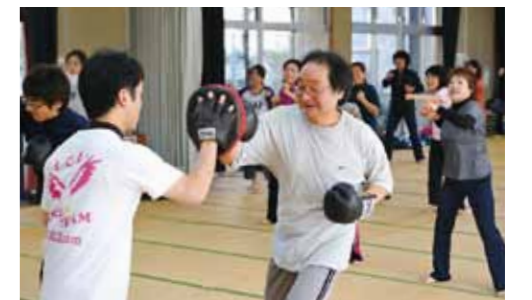
▲最終日のプログラム「ボクササイズ」で汗を流す参加者