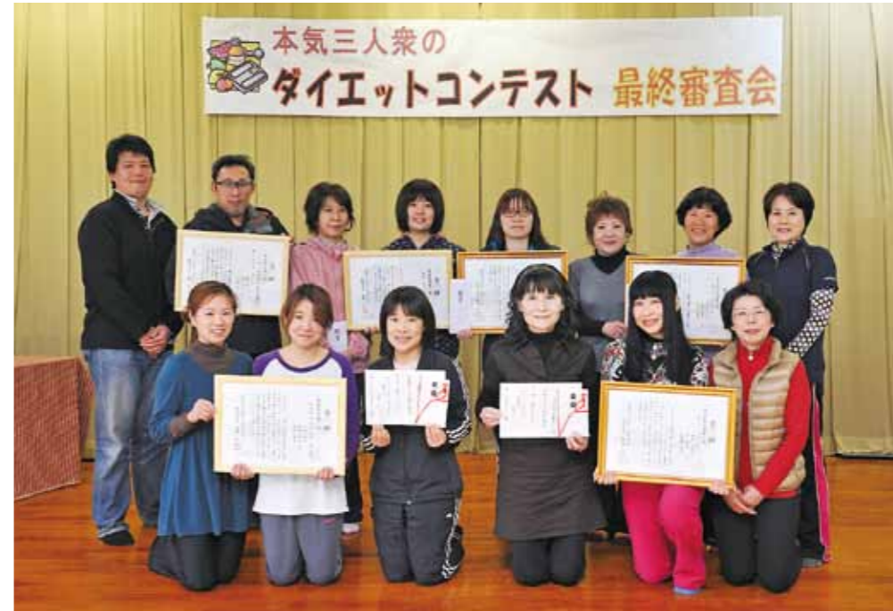
▲約8か月にわたるダイエットで健康的にスリム化に成功した各部門入賞者

昨年6月に開幕した「本気三人衆ダイエットコンテスト」の最終審査会が2月17日、健康センターで行われました。 生活習慣病の増加が深刻な本市の現状を打開しようと、今年度初めて開催した同コンテスト。47組（141人）が体重と体脂肪率の2部門でスリム化を競いました。 結果は体重部門で「ちびちびふれんず」が、体脂肪率部門で「あじさい」がそれぞれ第1位に輝き、表彰式では賞状と豪華賞品が贈られました。 参加者からは「食生活など、自分を見直すいい機会になりました。毎日の暮らしが楽しくなりました」、「血糖値が下がり、薬を飲まなくてよくなりました」といった声が聞かれました。