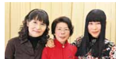
▲体脂肪率部門第1位「あじさい」 美しくやせるために、毎日30分の筋トレを欠かさず行い、食事では油分を控える、炭水化物を減らすようにしました。引き続き努力して「美魔女」を目指します。