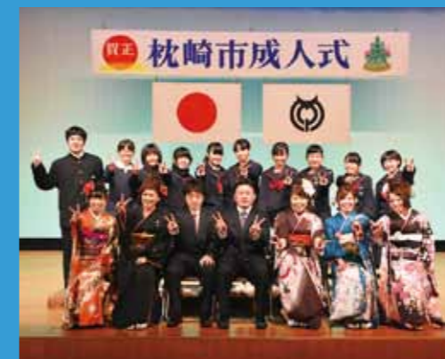
成人式実行委員とボランティアスタッフ

市内の小・中学生の10人がボランティアスタッフとして成人式の準備や、当日の受付をはじめ、照明・進行・舞台係として運営に携わり、新成人の門出に華を添えました。