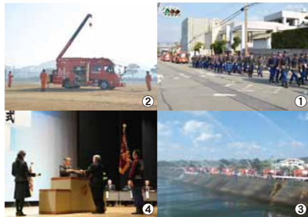
①街頭パレード ②救助工作車による実働訓練 ③放水披露 ④表彰式

このあと、枕崎小学校金管バンドを先頭に街頭パレードが行われ、その後、市民会館で日本消防協会など各団体等からの表彰及び表彰伝達式が行われました。