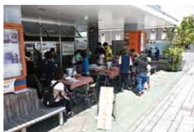
▲おれんじカフェの様子

本市では、4月22日に行われたヒルズ祭りでおれんじカフェのブースを開設し、子どもから高齢者まで約50名の方がカフェに立ち寄ってくれました。高齢者の現状や人口推移、認知症の方への接し方などを参加者へ説明し、認知症になっても住み慣れたまちで安心して過ごせるように、認知症に対する正しい理解や地域の支え合い、助け合いの重要性を呼びかけました。