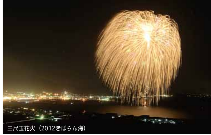
三尺玉花火 (2012きばらん海)

が初めて「さつま黒潮『きばらん海』枕崎港まつり」の花火打上げ総責任者になったのは、28歳の時でした。今年で36歳になるので、既に9年が経とうとしています。初めての年は十数万人もの観客が訪れる祭りの総責任者という重圧から、緊張のあまり些細なことで社員を怒鳴ったり、非常に神経を尖らせていました。