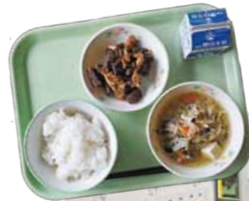
【今日の献立】 枕崎牛とポテトのくるみソース、 五目すまし汁、ご飯、牛乳