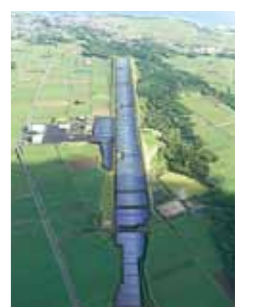
完成イメージ