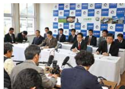
枕崎市役所での記者会見の様子