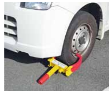
タイヤロックをした状態

滞納整理 ストップ滞納！自動車差押え「タイヤロック」を実施 市では、タイヤロックによる自動車の差押えを強化します。これは、自主財源の柱である市税収入の確保及び税負担の公平性を図るために行うものです。 再三の納税催告に応じない市税の滞納者が自動車(軽自動車、バイクを含む)を所有している場合、差押予告書を発送し、それでも指定する期限までに納税が無い場合には、タイヤロックを用いて自 動車を差し押さえます。タイヤロックを装着された自動車は走行できなくなります。 なお、タイヤロック装着後も全く納税が無い場合は、差し押さえた自動車を公売することになりますのでご注意ください。 納税が困難な方はご相談を やむを得ない事情で納税が困難な状況にある方は、早め