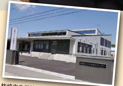
枕崎市立学校給食センター（中央町183番地4）

枕崎市立学校給食センターが12月に開催された全国学校給食甲子園決勝大会に九州・沖縄代表として出場し、大きな注目を集めました。今回、そんな給食センターの魅力を探りました。そこには、3つの“おいしいヒミツ”がありました。