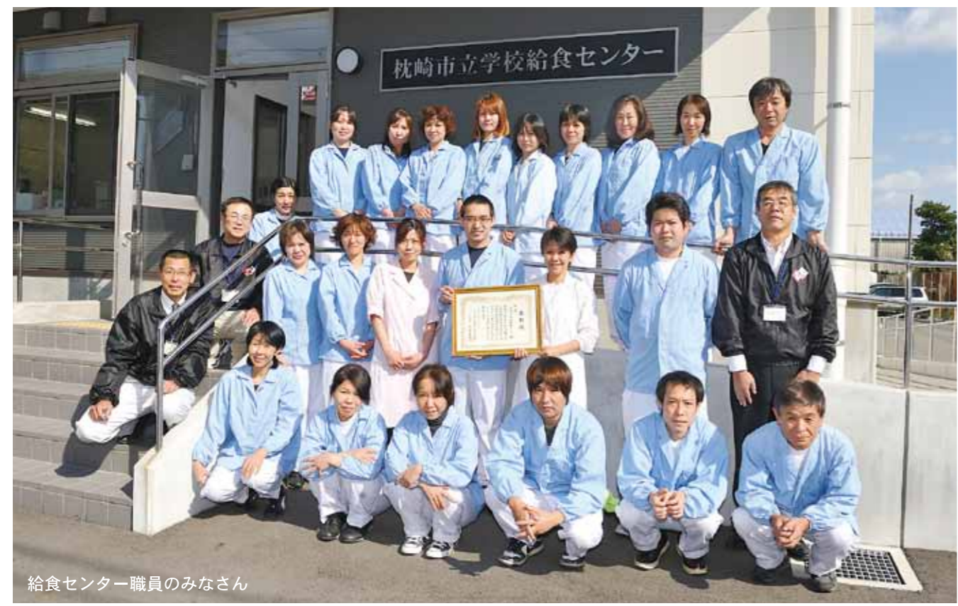
給食センター職員のみなさん