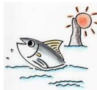
枕崎市立学校給食センターキャラクター 「カツオーシャン」