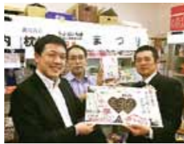
▲両市コンカツプロジェクト関係者

コンカツスイーツコンテスト表彰式 第2回コンカツスイーツコンテストの表彰式が3月18日、まくらざき春の市会場で行われ、受賞者に表彰盾と副賞が贈られました。 グランプリに輝いた「かぼちゃ三昧」をはじめ数作品は、市内菓子店で近々販売開始される予定です。 お楽しみに！ 東京「ちよだいちば」で「昆鯉」共同出展 3月1日から1カ月間、東京都千代田区のアンテナシヨップ「ちよだいちば」で、本市と稚