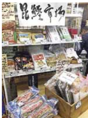
▲昆鯉市場コーナー

内市の両コンカツプロジェクトによる共同出展を行い、それぞれの特産品をPRしました。 「昆鯉市場」と銘打ったコーナーには両市の特産品約50点が並び、南北の食材が一度に購入できるという点もあり、来店者に好評でした。 期間中の3月16日には、両市の食を堪能するイベント「ちよい飲み」も開催され、参加者は枕崎「ぶえん鯉」や毛ガニなどの料理と焼酎を楽しみました。