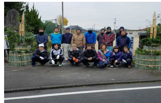
【立派な門松が完成しました】

午前8時30分からPTA事業部・三役・おやじの会役員の方々と門松作りを行いました。PTAのOBの方もお手伝いしてくださり、約1時間半ほどで完成しました。