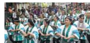
▲通りを練り歩く枕崎連

5月20日、東京渋谷にて「第15回渋谷・鹿児島おはら祭り」が2年ぶりに開催されました。若者や買い物客でにぎわう街で、揃いのほっぴや着物を纏ったよかにせとおごじよたちの踊り手2000人が通りを占拠しました。