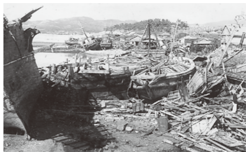
▲1951年に本市を襲ったルース台風は、死者27人3,223戸全半壊という甚大な被害をもたらした。

枕崎市はかつて「台風銀座」といわれていたように、「枕崎台風」や「ルース台風」をはじめ、411人が犠牲になった「黒島流れ」など、過去に台風により多大な被害を受けてきました。また、これから梅雨の時期には河川の氾濫や土砂崩れの恐れがあります。さらに東海・東南海・南海地震が同時に起きる3連動地震が発生した場合、震度5弱、最大3・7の津波が予想されており、その備えも重要になっていきます。