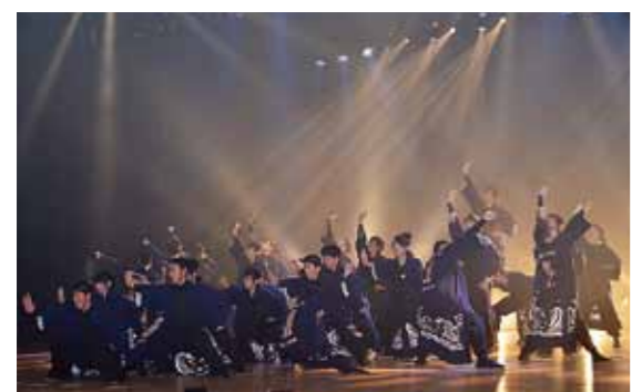
▲地元中学生による大迫力のソーラン節