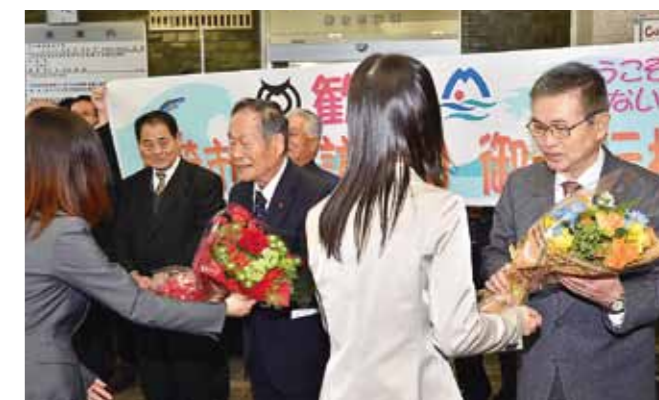
▲稚内市役所で歓迎を受ける本市からの訪問団

北海道稚内市との友好都市締結調印式が4月28日、稚内市で行われました。 昨年来、すでに交流が始まっていた両市。今回の締結により、今後さらに交流が加速し、両市発展の起爆剤になることが期待されます。