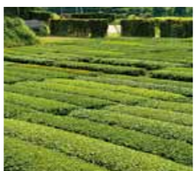
▲枕崎茶業研究拠点(瀬戸町)には、国内の100品種を超える茶樹を集めた国内最大級の保存園がある。

自分の地域の文化を他所の人に理解してもらうためには、海外に出て日本の歴史、文化、特長を語れない人は軽視されます。と、ここで、可愛いっすよね、鹿児島弁や枕崎弁、好きです。地域のためにも、方言が子どもたちの誇りになつてもらいたいですね。