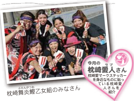
今月のラブ枕崎愛人さん 枕崎愛マークステッカーを身近なものに貼っている枕崎愛人さんを紹介

★応募方法 ハガキもしくはメールにて、氏名・ペンネーム・住所・電話番号・年齢・性別・クイズの答え・本紙へのご意見やご要望、枕崎への想いや身近にあった出来事などを記入の上応募ください。いただいたお便りは、ご紹介させていただく場合があります。文章は添削させていただきます。 ★応募先 〒898-8501 枕崎市千代田町 27 番地 「枕崎市役所総務課秘書広報係」宛 E-mail: koho@city.makurazaki.lg.jp ★応募締切 6月29日(金) ※当日消印有効 ★当選発表 当選者には総務課秘書広報係から連絡します。賞品を同係まで取りにきてください。 ★問合せ 総務課秘書広報係 TEL72-1111(内線211)