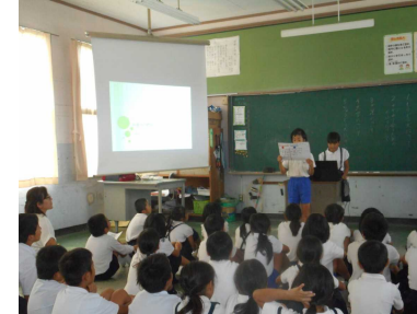
【10/14: 4年総合的な学習発表】