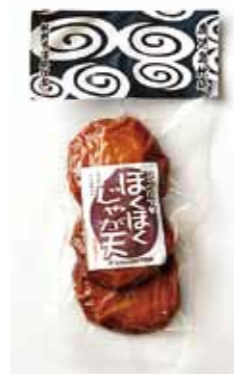
コンカツほくほくじゃが天

北の味が一度に味わえる」と好評でした。 「コンカツ新商品情報」 ◎コンカツほくほくじゃが天 北海道産じゃがいも、枕崎鯉節、利尻昆布を使った風味豊かなさつま揚げ 販売元・取扱店 松野下蒲鉾 TEL 7 2 2 3 2 8