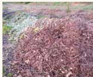
収穫残さを放置しないようにしましょう