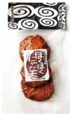
コンカツほくほくじゃが天

北の味が一度に味わえる」と好評でした。 「コンカツ」新商品情報 ◎コンカツほくほくじゃが天 北海道産じゃがいも、枕崎鯉節、利尻昆布を使った風味豊かなさつま揚げ 販売元・取扱店 松野下蒲鉾 TEL 7-2-2328