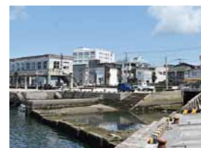
現在の神園川河口