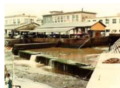
下水道供用開始前の神園川河口