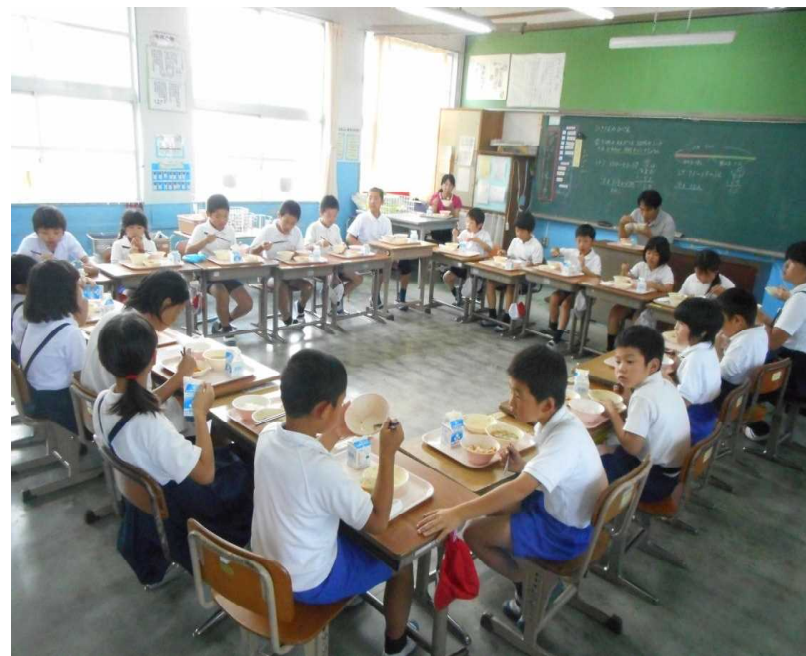
【2年教室で食べる子どもたち：行儀が良いです】

このような縦割り活動を通して、どの子に対しても公正・公平に接する子ども、そして、おもいやりの心をもった子どもを育ていこうと考えています。