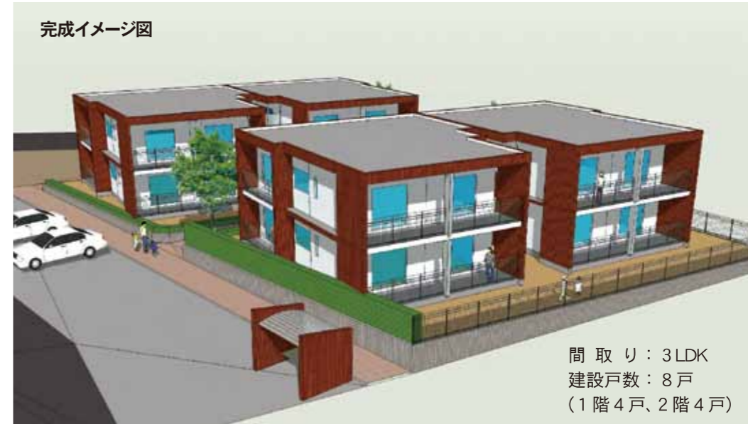
間取り：3LDK 建設戸数：8戸 (1階4戸、2階4戸)

市営住宅俵積田団地の建て替え工事が、10月22日に着工しました。完成は平成26年3月下旬の予定です。この住宅への入居開始を平成26年4月上旬に予定しています。 ■募集期間や要項等については、本紙1月号でお知らせします。