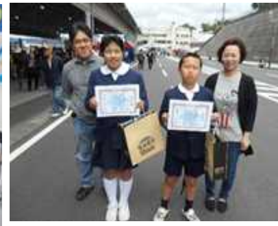
【受賞後の記念撮影】