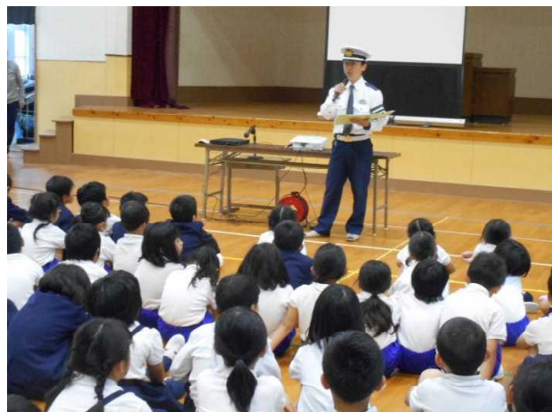
【おまわりさんのお話】