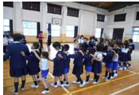
【じゃんけん列車の様子】

2～6年生の出し物が終わると、1年生から、「歌」 のお返しがありました。とても元気よく歌うことがで き、上級生や先生方から大きな拍手をもらいました。 最後は、全校で「じゃんけん列車」をして楽しいひと ときが過ぎました。