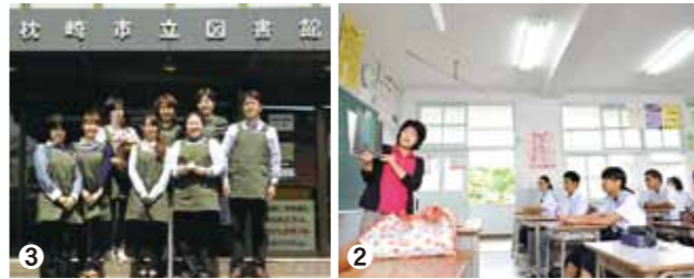
① 4月23日に開かれた「おはなしのへや」 ② 枕崎中学校での読み聞かせ ③ NPO法人「読書推進団体 枕崎みしのたぐかにと」スタッフ一同