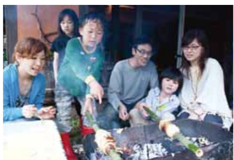
▲親子体験活動をする参加者 (自然花)

本をみても、家族化ではなく個性化していつてます。子どもの不登校や情緒不安などといった背後には、「どもに」が失われた家庭の状況が横たわっていることが多いのです。