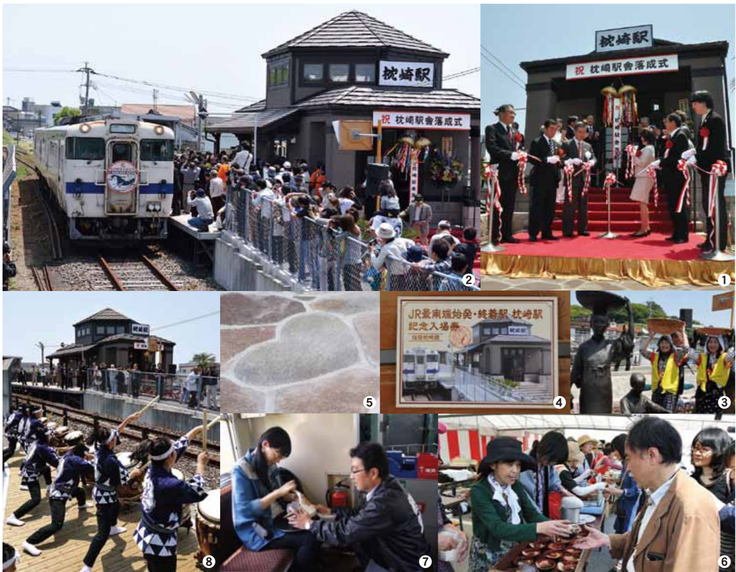
①テープカットの様子 ②記念列車の到着をたくさんの市民が迎える ③かつお節行商に扮した商工会議所女性会メンバー ④枕崎駅完成記念入場券 ⑤出会いの広場のハート形の石 ⑥「枕崎鯉船人めしSP」の振る舞い ⑦出汁の王国・鹿児島プロジェクトによる列車内での鯉節削り体験 ⑧火の神乙女太鼓によるオープニング