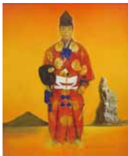
木村庄之助像(森一浩)