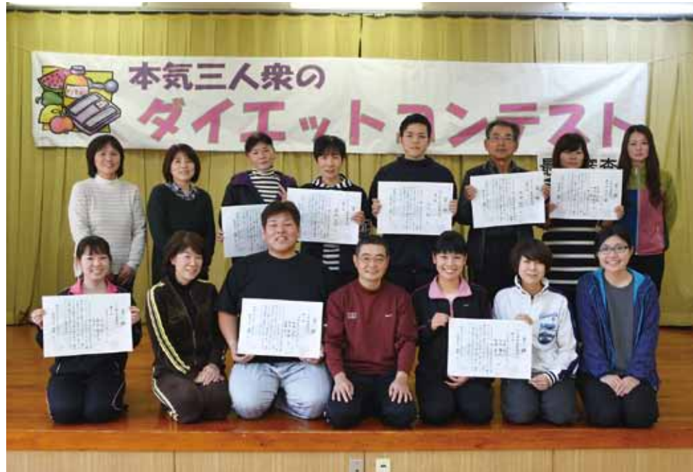
▲約8か月にわたるダイエットで健康的にスリム化に成功した各部門入賞者。