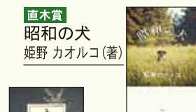
直木賞 昭和の犬 姫野 カオルコ(著)