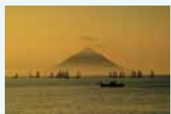
「暁に発つ」 田中一村記念美術館賞受賞作品