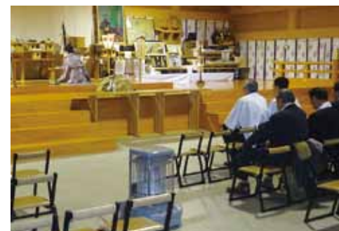
▲出雲大社での奉納のようす

この度のご結婚本当におめでとうございます。また、晴れの日に仲人の大役をさせていただき心から感謝申し上げます。最初この話を聞いたときに凄い話だなと思いましたが、この短時間の間にすぐこれが実現するとは私も驚きました。このスピード感に両市の熱意の表れを感じました。枕崎市、稚内市の両市がこのご縁を大切にいただき、末永いお付き合いを、そして私も仲人として責任がありますので今後の行く末をしっかりと見守っていきたく、色んな形で交流させていただけたらなと思っております。