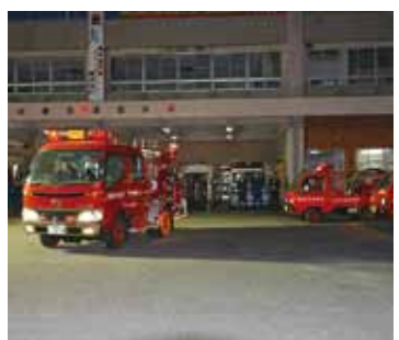
▲年末の火災予防の呼び掛けに出発する消防団員

う行為とともに自らも守るということ。そのためには、自分自身の体力と健康が維持されているということが重要です。私は70歳を越えて、腰に不安を感じ始めました。ここで次の若い方に団長職を譲るべきだと判断しました。 ⑤消防団員へのメッセージを 意思の疎通、これが要ですね。呑み二ヶーションといいますか、やはり普段から団員間の信頼関係を高めることです。各分団長には誇りと自信をもって大いに士気を上げていただきたいと望みます。 ⑥退任後はどのように過ごされますか タンカンを作ったついでに、奥が深くてなあ、やればやるほど面白か。やっぱり働いてこそ健康が維持されるもんだや。最後は元々の和やかな笑顔で語られた。 ⑦操作と放送を日頃、息らじ(唱)双方ともに、市民へ奉送