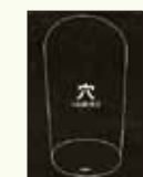
芥川賞 穴 小山田 浩子(著)