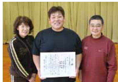
三人衆・体重部門 「いっやせるの?今でしょ!」チーム

健康センターで開催される体操教室やヘルシーランチ試食会などに加して、それを家でも実践するようにしたのが今回の結果につながったと思います。