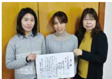
三人衆・体脂肪部門 「教委ガールズ」チーム

お医者さんに痩せるよう注意された事をきっかけに、同じ職場のメンバーで参加しました。日々、進ちょく状況を確認し合うなど、お互いに意識しながら頑張ってきました。