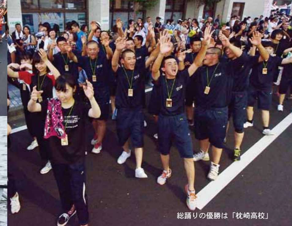
総踊りの優勝は「枕崎高校」