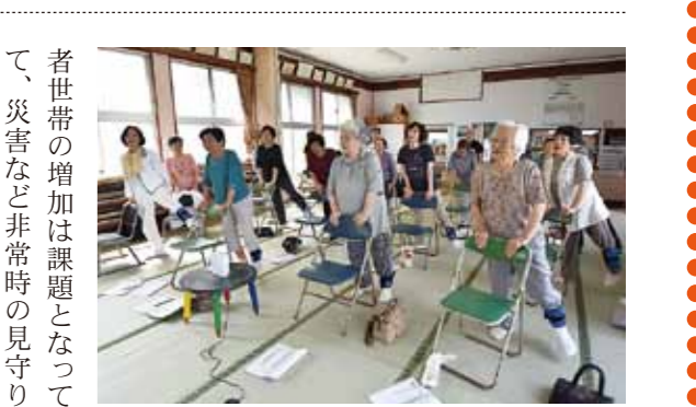
▲歌いながら体操をする参加者

「地域共生」とは、高齢者や障害者、子どもなど、すべての人々が、一人ひとりの暮らしと生きがいを共に創り、高め合う社会のことです。地域の絆が希薄になってきていて「同じ地域に住んでいても、名前を知らない人がいる」という声を耳にします。大堀公民館でも、事業を始めた頃は、お互い名前を知らないという人が多数いました。しかし、毎週集まって、一緒に広場を運営していくうちに、自然と会話が生まれ、少しずつ助け合うようになってきました。 地域に通いの場があるということは、地域にとって非常に重要なことです。本市では、今年度にて「げげ広場」事業を6カ所の公民館でスタートさせることを目標に、住民向け説明会を随時開催しています。高齢者が元気に過ごせれば、地域も元気になると思います。 あなたの公民館でも「げげ広場」事業を始めてみませんか。