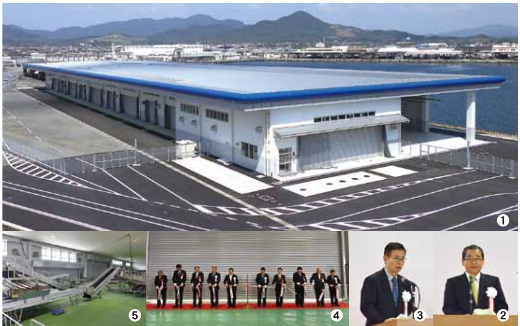
①完成した高度衛生管理型荷さばき所 カットの様子 ②荷さばき所内の設備 ②式辞を述べる伊藤祐一郎県知事 ③挨拶をする神園征市長 ④テープ