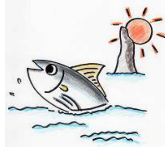
枕崎市立学校給食センターキャラクター 「カツオーシャン」