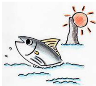
枕崎市立学校給食センターキャラクター 「カツオーシャン」