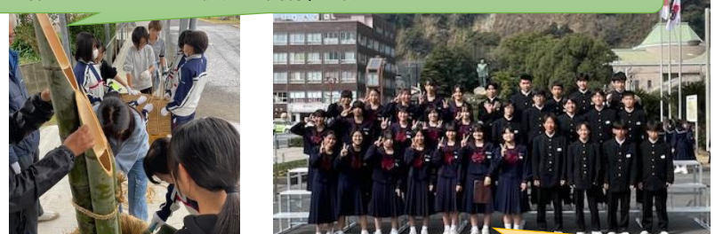
1月18日(日)2年2組が本校代表で「春の祭典」出場! 大舞台上で歌いきった後のほっとした表情でパチリ!

年末の門松づくり、希望者の生徒10名程で あーだこーだ言いながら作りました! PTA 役員の皆様、ご協力ありがとうございました。