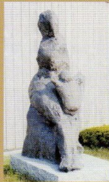
「風の母子像」 鈴木宏幸（東京都） 第2回「風の芸術展」準大賞