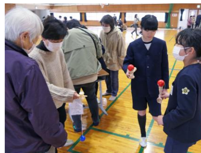
けん玉は子供たちのほうが上手です

子供たちはグループに分かれ、「こま回し」や「けん玉」「竹とんぼ」など9種類の昔の遊びを体験し、高齢者との交流を心から楽しんでいました。枕崎地区公民館の青少年講座も兼ねており、高齢者の方々も童心に帰って子供たちと一緒に全部の遊びを体験し、3年生との触れ合いに笑顔がこぼれていました。交流の後には子供たちがお礼の「夏祭り」の合奏を披露し、最後に枕崎小の校歌を全員で合唱して、楽しく盛り上がった交流活動になりました。