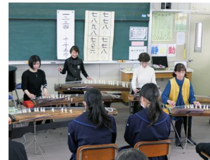
箏の演奏に合わせて生徒が歌う

コンサートの最後には「アンパンマンマーチ」「君をのせて」「サザエさん」のアニメソングを演奏し、生徒たちが一緒に歌って楽しみました。箏の生の音色と素晴らしい演奏に触れて、普段はできない貴重な体験をすることができました。