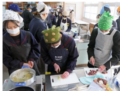
カツオとニンニクを包丁でカット

その後中学生は班に分かれて、鹿水高の方々に指導してもらいながら調理に取り組みました。カツオの皮はぎやニンニクのみじん切りなど難しい作業もありましたが、最後は美味しい「かつおのガーリックパスタ」ができ上がりました。