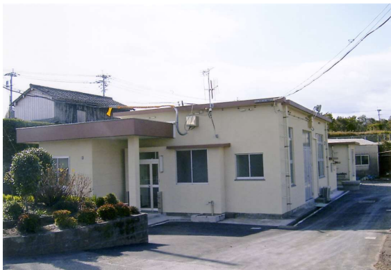
深浦ポンプ場管理棟