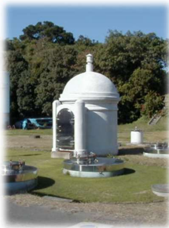
深浦ポンプ場 シンボルの円筒の建物

水質汚染事故が発生した場合、枕崎市役所市民生活課、加世田保健所、鹿児島県保健福祉部生活衛生課、水道関係事業者等と情報交換するとともに、連携して現地調査、水質検査等を行い、対策を講じます。