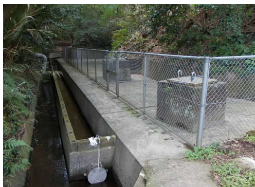
深浦水源浅井戸1号～2号