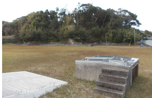
深浦水源浅井戸3号～7号