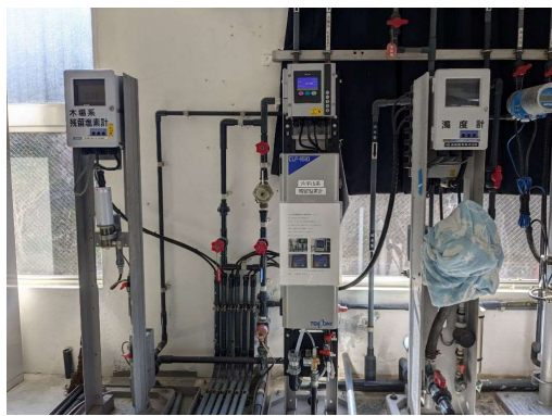
深浦ポンプ場 水質検査計器