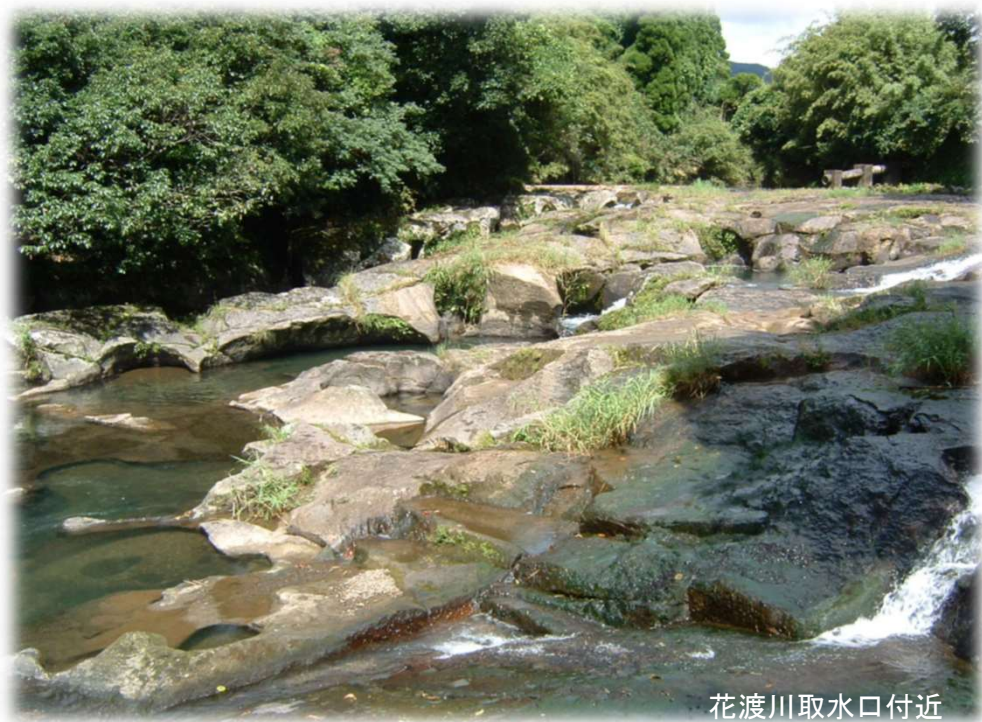
花渡川取水口付近