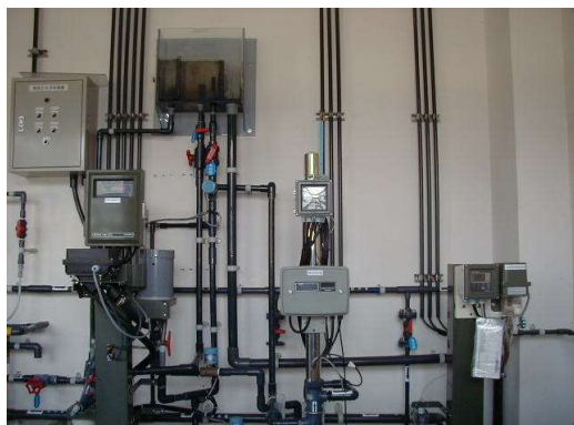
金山浄水場 水質検査計器

また、別府地区においては、連絡管により枕崎系(岩戸配水池)から送水をしています。花渡川表流水については、降雨時による濁度の上昇及び水質の変化、油流出事故等の注意すべきものがあり水質管理に万全を期しています。