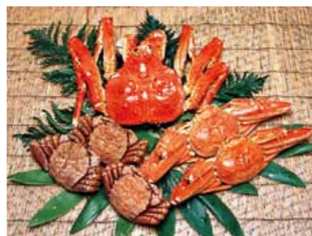
▲身が引き締まった3大ガニ

2月から春先にかけては、タラバガニ、ズワイガニ、毛ガニの漁が盛んです。 この時期水揚げされたカニは、身が引き締まってとても美味しいです。 冬のイベントなどを体験し、