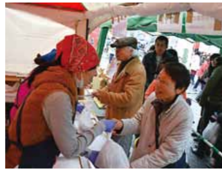
▲お客様を笑顔でおもてなし