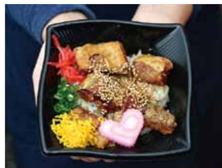
▲枕崎鰹大トロ丼 (Show-1バージョン)