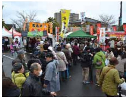
▲本大会でも長蛇の列