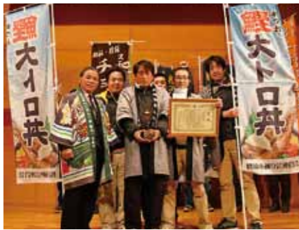
▲表彰式後の記念撮影