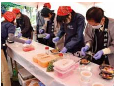
▲調理も協力し合いながら手際よく

新グルメのテーマは「コンカツ（昆鰹料理）」。開発当初は、昆布と鰹節から取った出汁を入れたカレーや、肉を使った丼などさまざまな案が出たそうです。それから何回も話し合いと試食を重ね、最終的に「やっぱり枕崎で有名なのはカツオ。だったら腹皮を使おう」ということになったそうです。「腹皮を使った料理」ということが決まってからは、「鰹節屋のまかないめしをアレンジした料理」をコンセプトに調理法の具体的な話に進みました。イベントでの調理になることから、重要ポイントは「早くできあがること」。それは枕崎鰹船人めしで戦ったことから学んだものでした。そこで、揚げあがり時間を短くするため、ひと口大に切った腹皮を竜田揚げにし、トロの食感を出すため昆布と鰹節の出汁にとろみをつけたあんをかけることに。「トロ」と「とろみ」も実はひ