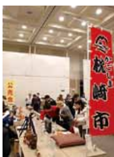
▲合同公売会の様子