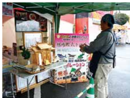
▲本大会開始前の必勝祈願