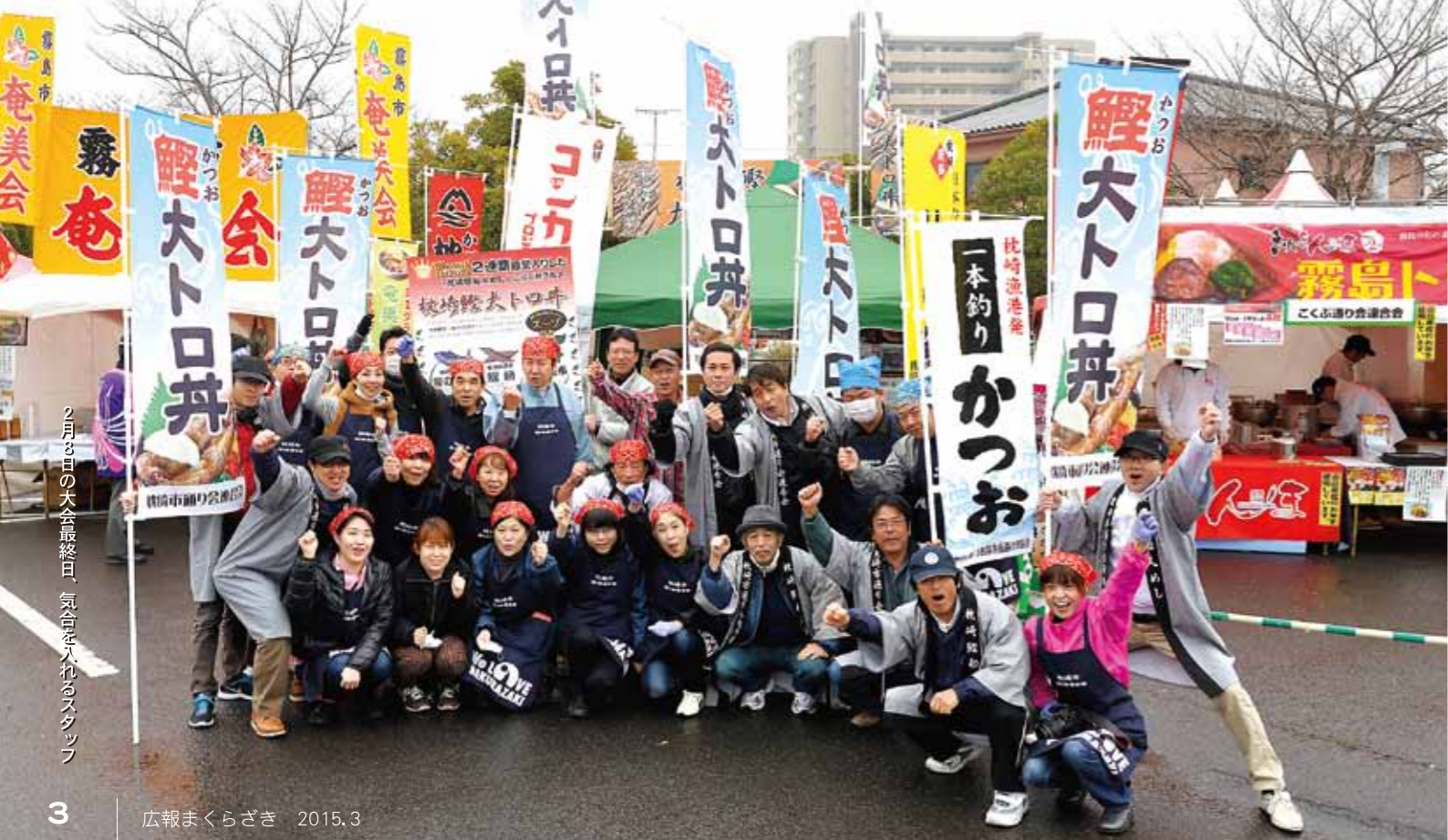
2月8日の大会最終日、気合を入れたスタッフ