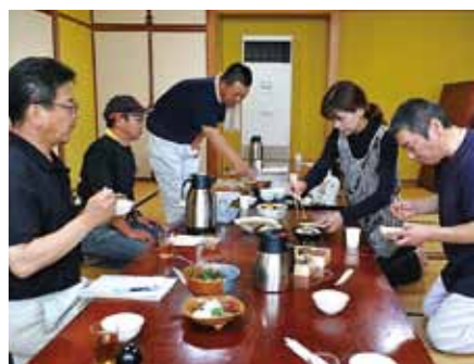
▲開発会議での試食の様子

昨年10月から始まった県内の商店街グルメナビを決定する「Show-1グルメグランプリ」。2月7日、8日に霧島市で本大会が開催され、枕崎市通り会連合会の「枕崎鰹大トロ丼」が見事グランプリを獲得しました。同連合会は、2011年、2012年にグランプリを獲得し、殿堂入りを果たした「枕崎鰹船人めし」に続き、3回目のグランプリ獲得となりました。