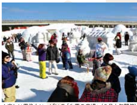
▲楽しい雪像もいっぱい「氷雪の広場」(2月上旬開催)

1年間「稚内便り」を掲載させていただき、ありがとうございました。 枕崎市の皆さんに少しでも稚内のことを知ってもらえて、行ってみたいなあと思っていただけなのなら嬉しいです。 今後とも「夫婦都市」としていい交流ができればいいですね。