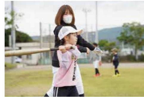
▲11月30日に開催された親子野球教室の様子