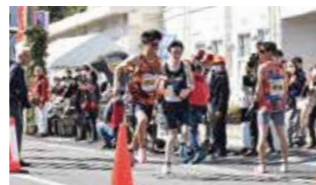
令和6年県下一周市郡対抗駅伝競走大会の様子▲