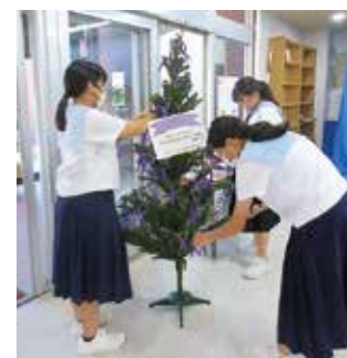
▲「女性に対する暴力をなくす運動」期間の取り組み(令和6年11月)

11月には市立図書館で「女性に対する暴力をなくす運動」の特設コーナーが設けられました。枕崎小学校、枕崎中学校のボランティアの皆さんは、そのシンボルとなるパープルリボンの飾りつけを行ったり、啓発用の本のしおりを作成したりするなど、人権や命を大切にすることに理解を深めました。