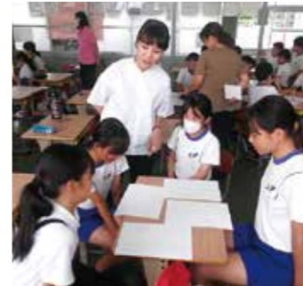
▲立神小学校でのワークショップ(令和6年9月)

9月に立神小学校で行われたワークショップでは、児童たちが一人一人の違いを実感しながら、自分自身を振り返る機会となりました。