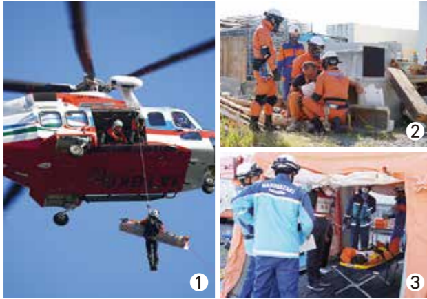
①県消防・防災ヘリコプターによる孤立者の救出訓練 ②行方不明者捜索訓練 ③枕崎医師会によるトリアージ訓練および応急処置訓練

10月12日、枕崎市消防署南側訓練場および立神社周辺において、集団災害訓練が実施されました。市消防本部、市医師会、枕崎警察署など9団体81名が参加しました。